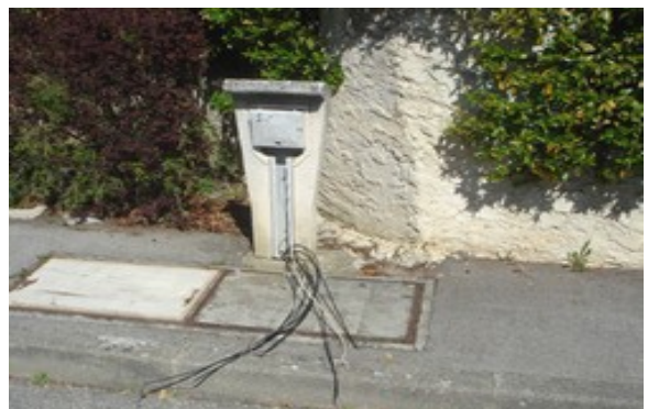
Dégradation de borne téléphonique

Plusieurs actes de malveillance ont été constatés en 2015 dans le lotissement : dégradation de bornes téléphonique, débris dans la croisée des chemins, enlèvement des barrières entre les deux lotissements.