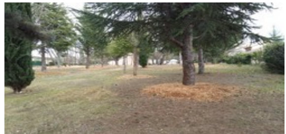
Travaux réalisés sur le terrain commun

En 2015 un important chantier d'élagage a été réalisé. Les arbres situés sur le terrain commun ont été taillés. Ces travaux ont coûté 3 500 €.