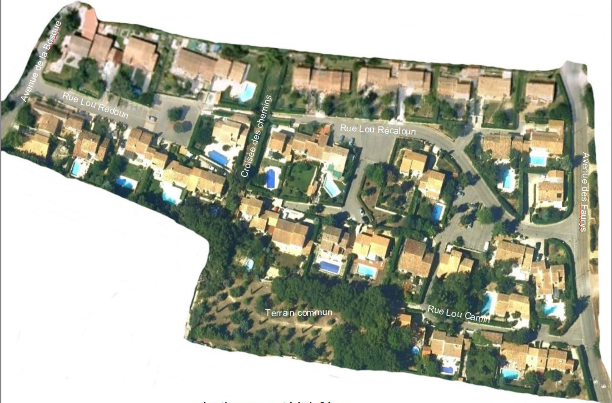
Lotissement Val Clos